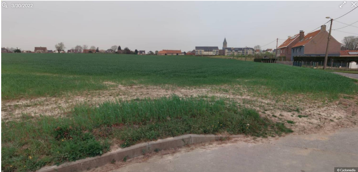
Zicht op de kerk vanaf de spoorweg

Voor de bewoners van Anzegem wenst het gemeentebestuur deze plek een nieuwe betekenis te geven voor gemeenschapsgebonden gebruik; een nieuwe verblijfsruimte toegankelijk voor iedereen en waarbij ontharding kan worden ingezet om de link tussen dorp en landschap opnieuw te realiseren. Dit is om de kerkomgeving als hart van het dorpscentrum van Anzegem opnieuw te ontsluiten voor een breder publiek. Belangrijk hierbij is dat wordt gezocht naar een vernieuwde en versterkte verankering van de kerkomgeving in het omliggende dorpsweefsel en met de buurtgebonden functies. De gemeente is op zoek naar een kwalitatieve invulling met een multifunctioneel gebruik. De kerkomgeving blijft haar publiek karakter behouden, maar kan tijdelijk en beperkt voor festiviteiten worden ingezet (al dan niet aanvullend op een activiteit die plaatsvindt in het schipdeel).