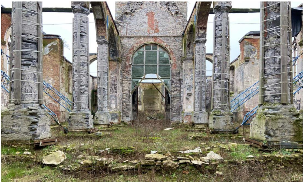
Zicht op afgebrande schipdeel

Om te komen tot een visie op het schipdeel werd in 2021 een beroep gedaan op de begeleiding door het Projectbureau Herbestemming Kerken. Naast nieuwe inzichten over de invulling van het schip, werd ook gevraagd een visie te ontwikkelen voor de site naast de kerk (zone van het gemeentehuis en parking). Aangezien het de bedoeling is alle gemeentelijke diensten onder te brengen in het nieuwe gemeentepunt langs de Heirbaan, zal het huidige hoofdgemeentehuis naast de kerk immers binnen enkele jaren verlaten worden.